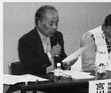
「地域福祉の財源」では民生委員の立場から日常の活動を通じて財源確保の大変さについてお話しをいただきました。