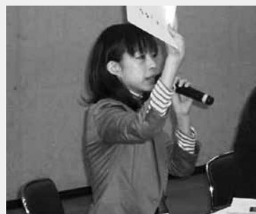
「障害児余暇支援活動」では、余暇支援活動の報告があり、地域で何ができるのか？また当事者として何ができるのか？これからの課題が明確化されました。