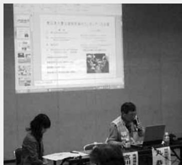
被災地に何度も足を運んだ丸さんの話は説得力がありました。