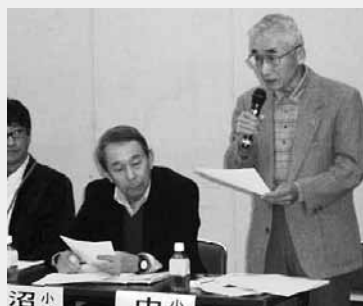
「小地域福祉活動推進計画」では、事務局より小地域福祉活動について説明を行ない、その後に先駆的な取組みを行なっている地域の活動発表がありました。