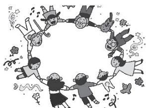
ボランティア・NPO、サロンなどへの助成

（※）2019年度葉山町社協では共同募金配分金を以下の各事業に活用させていただいています。