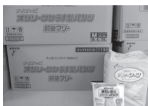
介護用品のお届け