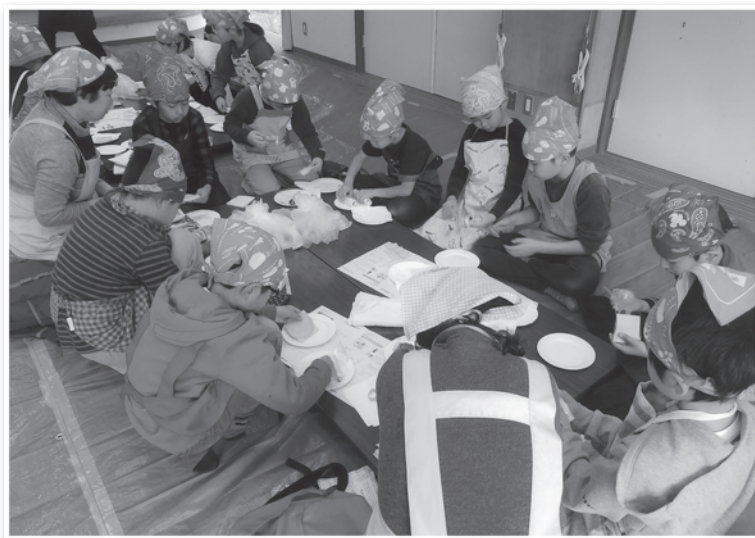
子育て（親子）食育サロン

3月の際には作ったお弁当を持って、同じ日に木古庭公園で実施するお花見会（地域交流会）に合流し、高齢者との交流も行っています。