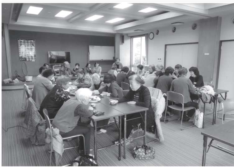
木古庭ゆめサロン

福祉委員会では、独居高齢者を中心に訪問見守り活動もしており、見守り活動からの紹介をきっかけにサロンに参加している方もいらっしゃいます。