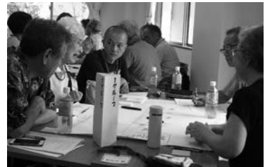
令和元年七月二十九日 研修の風景

住民の皆さんの支え合い・助け合いを推進し、住み良い地域を作るために、今後も活動していきます