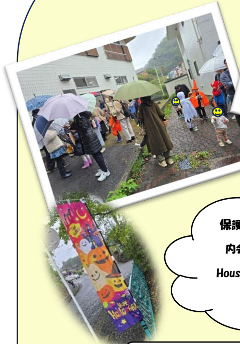
パークド葉山四季

社会福祉協議会 一色地区のコーディネーターが、一色地区の情報や活動する団体などを分かり易くお知らせしています。