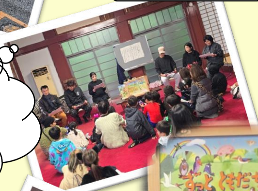
いっしき海岸子ども会

保護者の方々の紙芝居を見た後は町 内会を回ります。Trick-or-Treat Houseの皆さんは毎年子どもたちが来 るのを楽しみにしています。