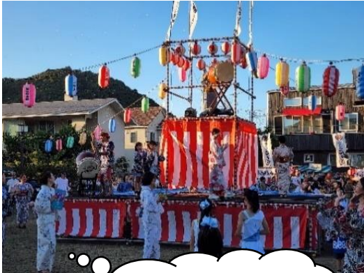
子ども会のお母さんたちの見事な踊り

一色地区のコーディネーターが、一色地区の情報や活動する団体などを分かりやすくお知らせしています。