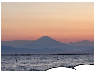
のんびりした雰囲気がある葉山の花火大会の良さは？