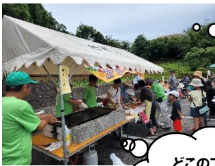
どこのブースも長蛇の列

猛暑の中、一色では様々なイベントが開催されました。コロナで人と人がつながることが難しかった時期が一旦落ち着き、今年は住民の方たちの「パワー」を感じられる夏でした。 皆さんの夏の思い出は？