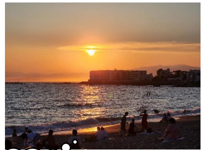
花火大会 当日の夕日

猛暑の中、一色では様々なイベントが開催されました。コロナで人と人がつながることが難しかった時期が一旦落ち着き、今年は住民の方たちの「パワー」を感じられる夏でした。 皆さんの夏の思い出は？