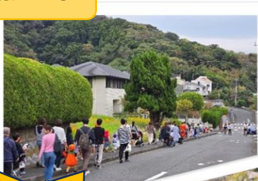
パークド葉山四季