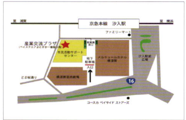
■横須賀市産業交流プラザ 京浜急行 汐入駅 徒歩1分